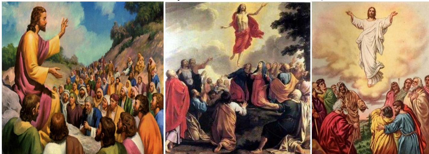
Terça-feira da 1ª Semana do Advento